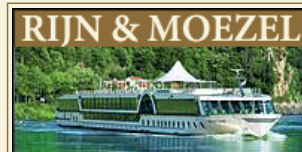
MS Amadeus Classic

Amadeus Classic behoort tot de Amadeus vloot, maar deze cruises worden door een andere reisorganisatie uitgevoerd en heeft een andere service waarbij geen wijn bij de diners is inbegrepen.