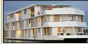
MS Zambezi Queen

17 dagen. Golden Trials of East Africa. Incl. Wijn bij lunch & diner. Johannesburg , Chobe River, Victoria Falls, Arusha, Taragire, Ngorongoro, Serengeti, Arusha Vertrek: maart- november 2017 Vanaf 17848 €