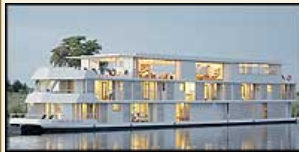
MS Zambezi Queen

13 dagen Falls, Rivers & Rails Incl. Wijn bij lunch & diner. Kaapstad, Chobe River, Victoria Falls, Rovos Rail. Vertrek: mrt, apr, mei, jul, aug, sept, okt. 2017 - Vanaf 15789 €