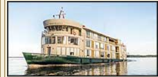
MS Amazon Discovery

11 dagen, Inclusief heen- en terugreis. Lima, Cusco, Machu Pichu, Iquitos, Amazone, Lima Vanaf 7699 € pp