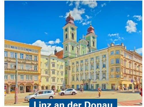
Linz an der Donau

Die Hauptstadt Österreichs gehört zu denjenigen Städten, die jeder Reisende im Laufe seines Lebens einmal besucht haben sollte. Kaum eine andere Stadt der Welt hat eine so bezaubernde Kombination aus prachtvoller Architektur, weltberühmten Museen und Theatern und wunderschönen Grünanlagen zu bieten. Kein Wunder, ist die gesamte Wiener Innenstadt Teil des UNESCO-Weltkulturerbes. Weltweit bekannt ist Wien für seine Paläste von Kaisern, Königen und Adeligen, wie das Schloss Schönbrunn, das Belvedere und die Hofburg. Aber auch die vielen Kirchen der Stadt, allen voran der Stephansdom als Wahrzeichen, sind einen Besuch wert. Museumsbesucher kommen bei den zahlreichen Weltklasse-Museen der Stadt, sowieso voll auf ihre Kosten.