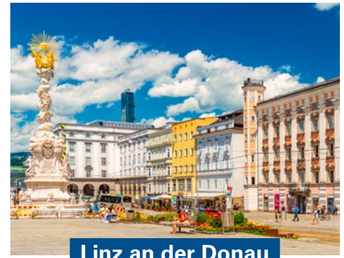
Linz an der Donau

Melk hat sich einen schönen Namen zugelegt: das Tor zur Wachau. Wer sich auf der Donau der historischen Stadt nähert, der entdeckt schon sehr früh das Stift Melk, das hoch über dem Fluss thront. Die Abtei ist ein Teil des Weltkulturerbes der UNESCO und zu allen Jahreszeiten ein Besuch wert. Das eindrucksvolle Barock-Ensemble wird seit dem Jahr 1089 von den Mönchen des Benediktiner-Ordens betreut. In den prächtigen Räumen des Klosters vereinen sich Kultur, Glaube und Wissenschaft.